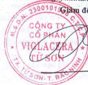
Trần Xuân Hùng